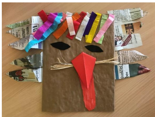
Mia, 5 let.