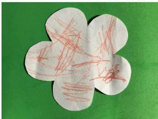
Nejc, 1 leto.

Delovni čas je prilagojen potrebam staršev, tako da vrtec posluje od 5.30 do 16.00 v vseh treh enotah. Vrtec obiskujejo otroci, ki potrebujejo celodnevno vzgojo in varstvo.