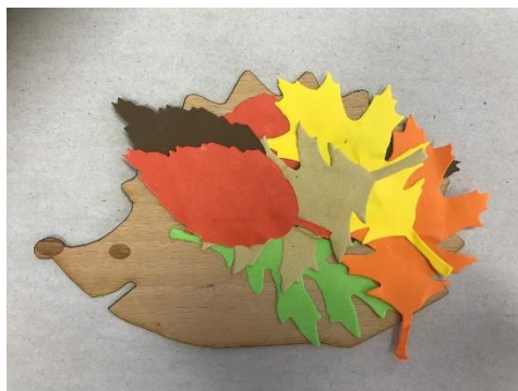
Val, 3 leta.

Stalni ritem prihodov in odhodov iz vrtca daje otroku občutek varnosti in zaupanja, zato, starši, izpolnite obljube, ki jih dajete svojim otrokom.