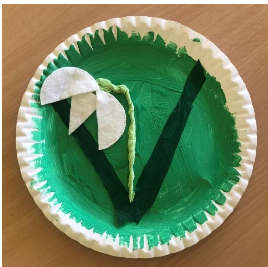
Nejc, 5 let

Starši otroka osebno predate vzgojiteljici ali pomočnici vzgojiteljice. V primeru da pride kdo drug po otroka, starši oddate pisno pooblastilo.