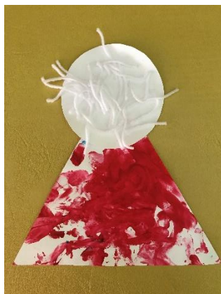
Kataya, 1 leto.

Sodelovanje med vrtcem in starši je zelo pomembna plat kakovosti predšolske vzgoje.