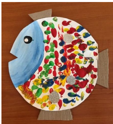
Stella, 4 leta.