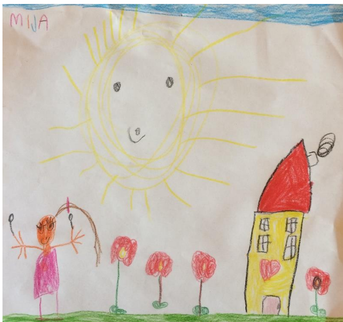
Mija, 6 let.

Starši otroka osebno predajo vzgojiteljici ali pomočnici vzgojiteljice. V primeru da pride kdo drug po otroka, naj starši oddajo pisno pooblastilo.