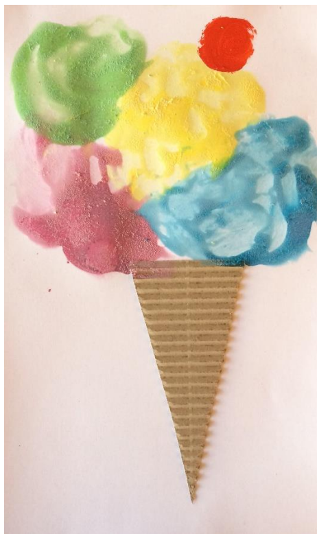
Anže, 2,5 let.

Stalni ritem prihodov in odhodov iz vrtca daje otroku občutek varnosti in zaupanja, zato, starši, izpolnite obljube, ki jih dajete svojim otrokom.