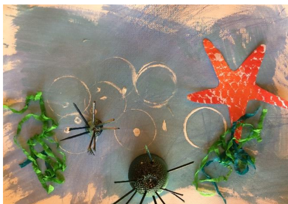
Tai, 3 leta.